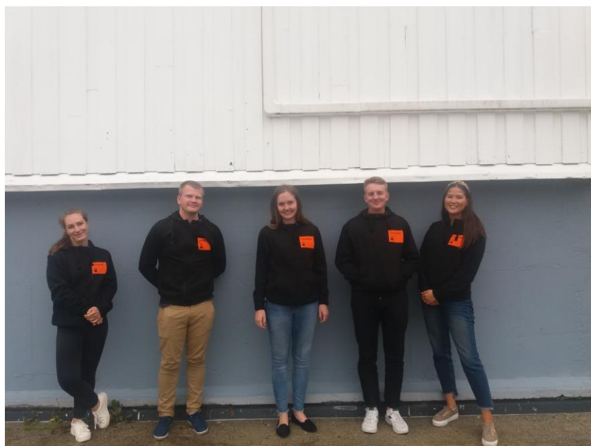
Frivillige legger ned betydelig innsats - her er noen av Gatejuristen Stavangers frivillige studenter

Gatejuristen Stavanger vil rette en særlig takk til alle de som har bidratt frivillig i 2020. De frivillige tilfører kompetanse, erfaring og frivillige timer – som gjør at vi kan jobbe oppsøkende og gi kostnadseffektiv rettshjelp av god kvalitet til våre klienter.